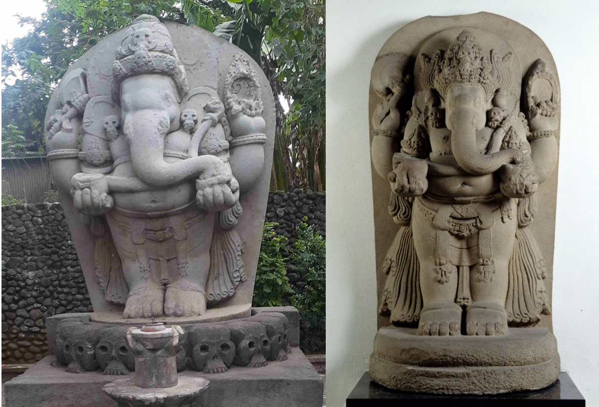
Links: Beeld van Ganesha te Karangates, regentschap van Malang. Rechts