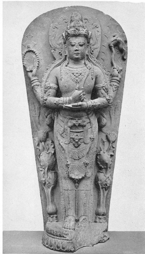
Picture 1: The statue of Shiva Mahadeva from Kidal Temple, representing the deified image of King Anusapati of Singhasari, who reigned from 1227 to 1248 CE.

Kidal Temple is located in Rejokidal Village, Malang Regency. Based on its architectural style, the temple dates back to the 13th century CE, during the Singhasari Kingdom period. According to the Pararaton manuscript, King Anusapati (also known as Anusanatha), who ruled Singhasari from 1227 to 1248 CE, was deified at Kidal Temple. The inner chamber of the temple originally housed a statue of Shiva Mahadeva, which functioned as a deified portrait of the deceased king. The statue exhibits characteristics of Singhasari art, notably the pair of ornaments emerging directly from the base on either side of the figure. In contrast, statues from the Majapahit period